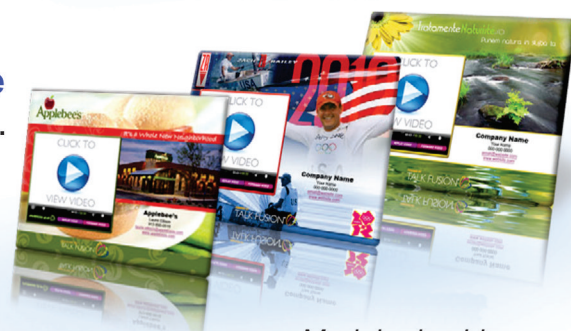
Modele de video email personalizate