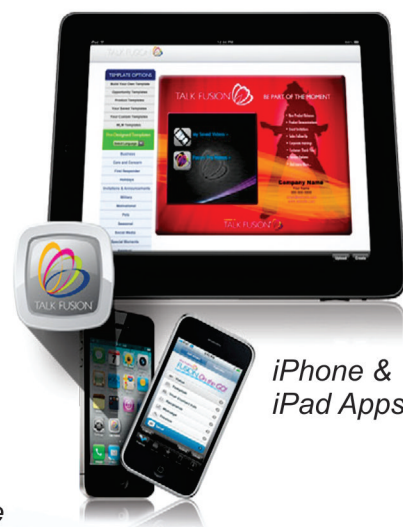
Formulare de E-abonare

Sponsorizați personal 1 asociat activ pe echipa dvs. din stânga și 1 pe echipa dvs. din dreapta și deveniți Bronz. Când îi ajutați pe asociații dvs. personali să devină Bronz pentru prima dată și în 30 de zile de la înregistrare, dvs. deveniți Creator de Bronz și veți câștiga un Bonus de creator de Bronz de 20$ .